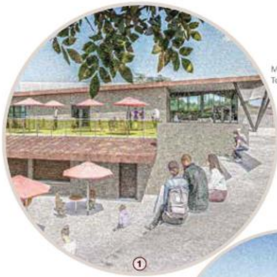
Multi-level patios / Terrasses à plusieurs niveaux