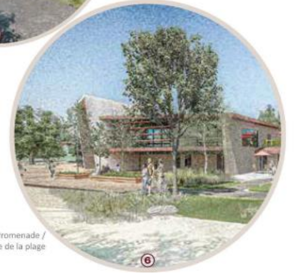
Beach Promenade / Promenade de la plage