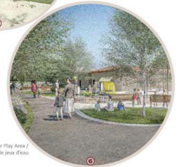
Water Play Area / Aire de jeux d'eau