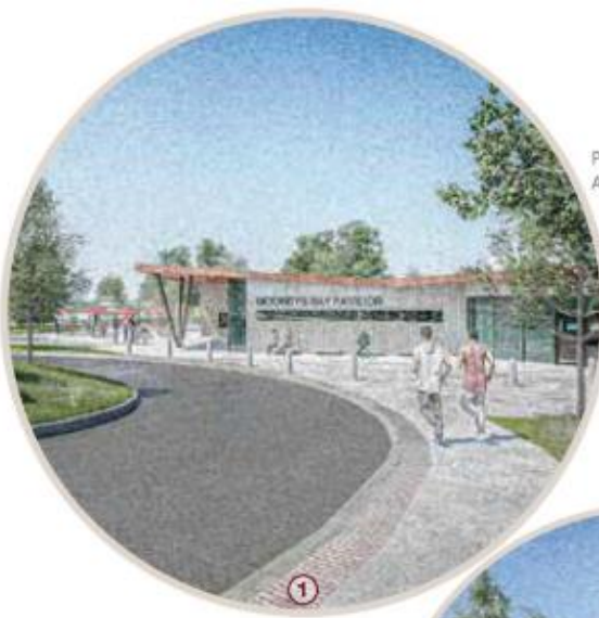
Pavilion Vehicular Access Lane / Accès véhiculaire du pavillon