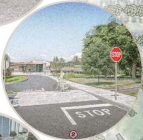
Raised Multi-Use Pathway Crossing / Passage surélevé du sentier polyvalent