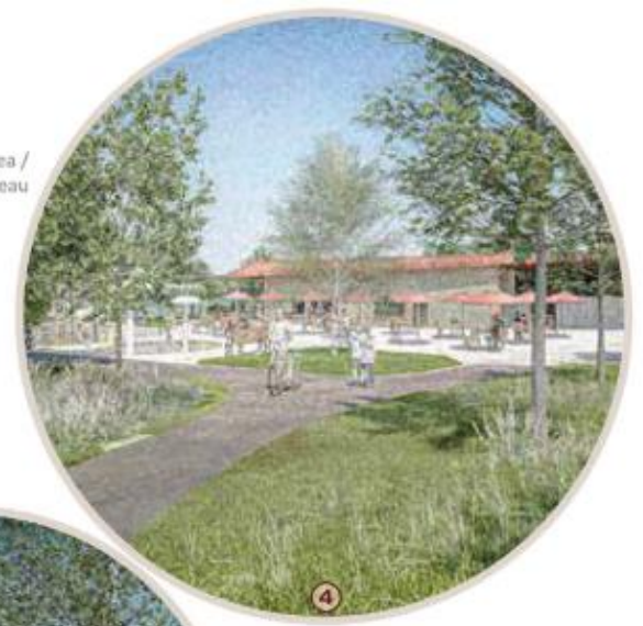
Beach Patio and Water Play Area / Terrasse de la plage et aire de jeux d'eau