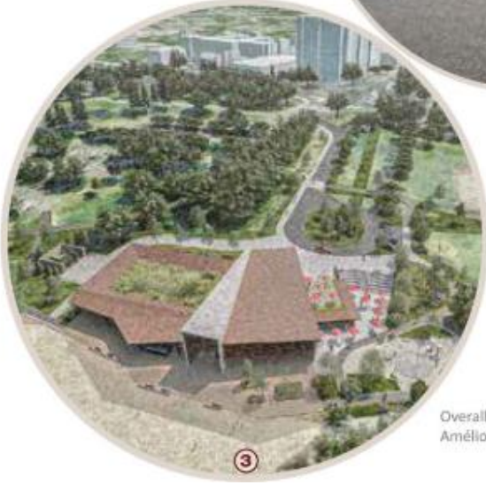
Overall site improvements / Améliorations générales du site