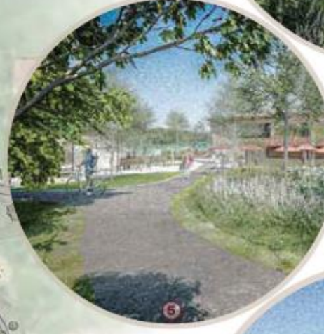
Walkway to the beach / Sentiers menant à la plage