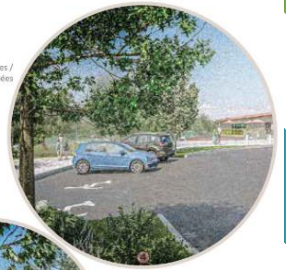
Parking Area for persons with disabilities / Aire de stationnement pour personnes handicapées