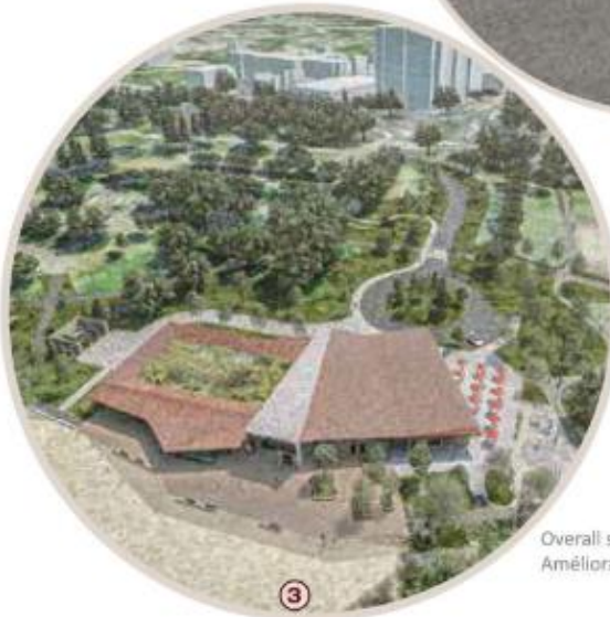
Overall site improvements / Améliorations générales du site